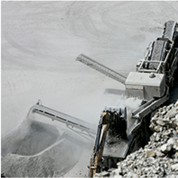
Feinmaterial als kritische Fraktion von Bauabbruch.

----- PRESSEINFORMATION 8. August 2019 || Seite 4 | 5 -----