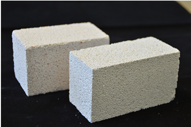
Porenbeton aus Ziegel (hinten), Porenbeton aus Kalksandstein (vorne).