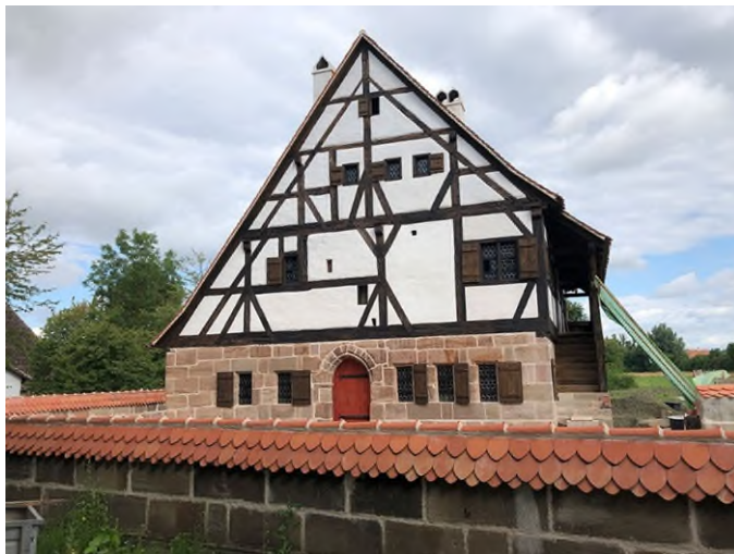
Das historische Badhaus im Freilandmuseum Bad Windsheim.