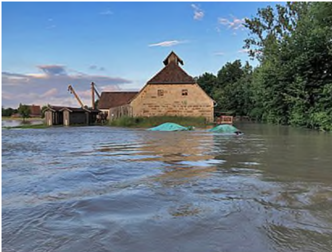
Vom Aisch-Hochwasser im Juli 2021 betroffene historische Gebäude.