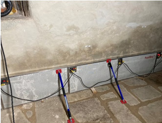
Das FastDry-System im Einsatz im historischen Badhaus.